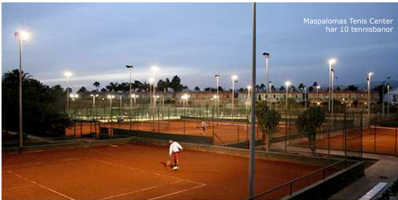
Maspalomas Tennis Center har 10 tennisbanor