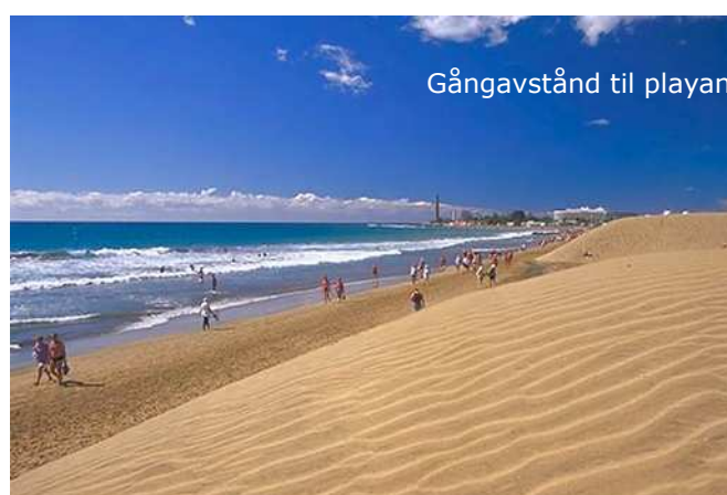
Gångavstånd til playan

Vi rekommenderar dock att ni tar halvpension för smidighetens skull, samt det sociala med gruppen. Vi har möjlighet att byta middag till lunch om det passar oss bättre (normalt ingår frukost och middag). Barn upp till 12 år får 50% rabatt på halv-pensionen. Barn 0-6 år äter gratis. Åker man med utan att vara med i vår träning får man rabatterat pris: 3500 kr.